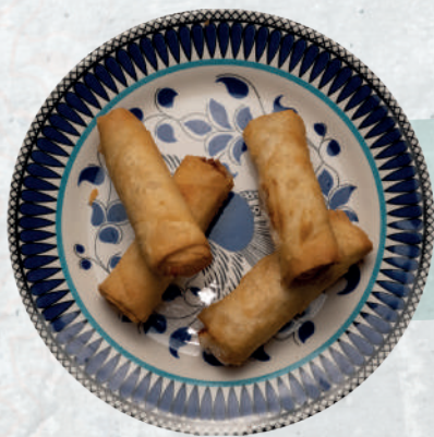
Sigara Borek - fritto Pastasfoglia con formaggio turco € 5,90