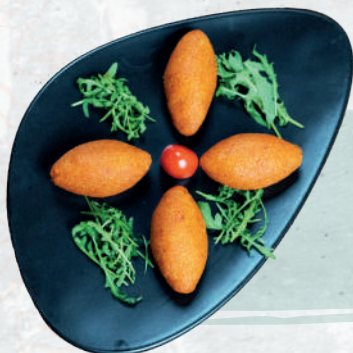
Polpette di Bulgur con carne macinata di vitello € 11,90