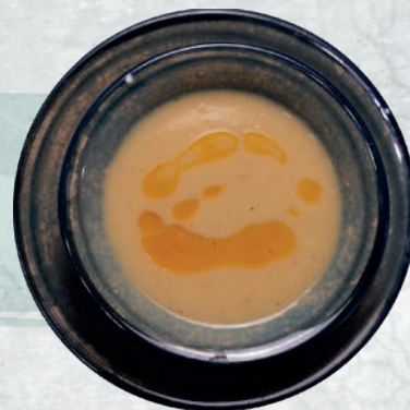
Zuppa di Lenticchie rosse Lenticchie rosse, cipolle, aglio, carote, patate € 6,90