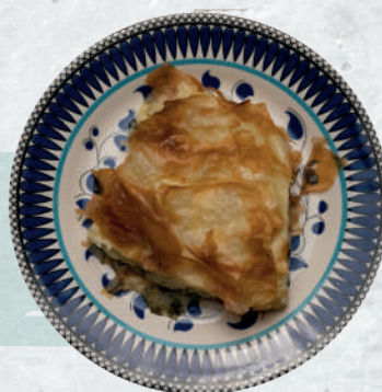
Su Borek - al forno Pastasfoglia con formaggio turco e prezzemolo € 5,90